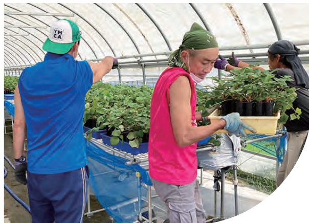
東日本大震災支援対策室