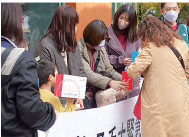
国際・地域協力募金

Positive Netとは互いの存在や個性を認め合い、高め合うことのできる、善意や前向きな気持ちによって繋がるネットワークのことです。課題の多い社会の中で、それが生きるためのひとつの選択肢となっています。私たち仙台YMCAはネットワークを活かしてPositive Netを広げ、希望ある・より豊かな社会を創ることを皆さまと共に目指します。