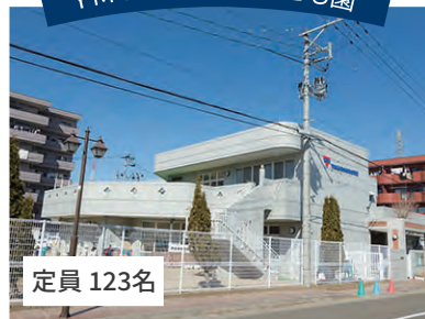
YMCA南大野田こども園